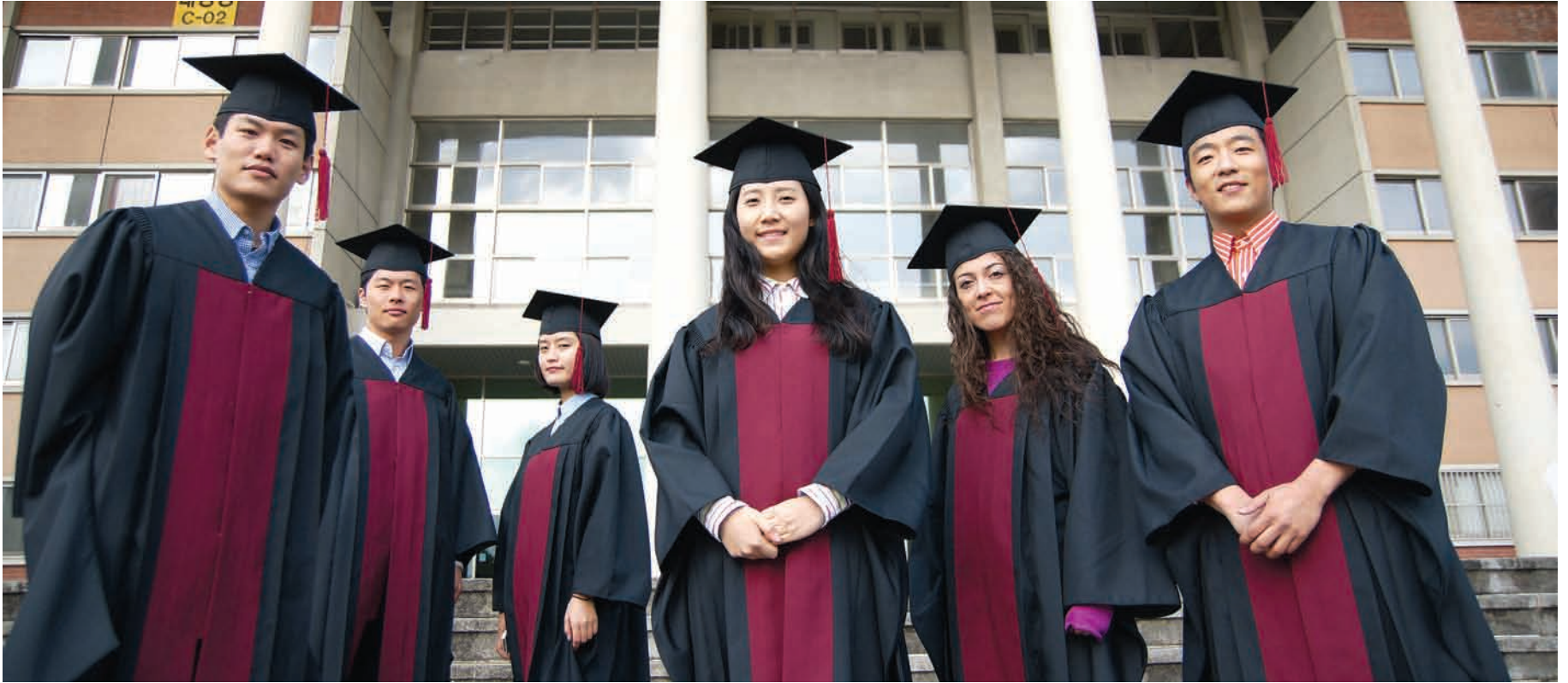
창의성과 인성으로 국가와 지역사회에 기여한다