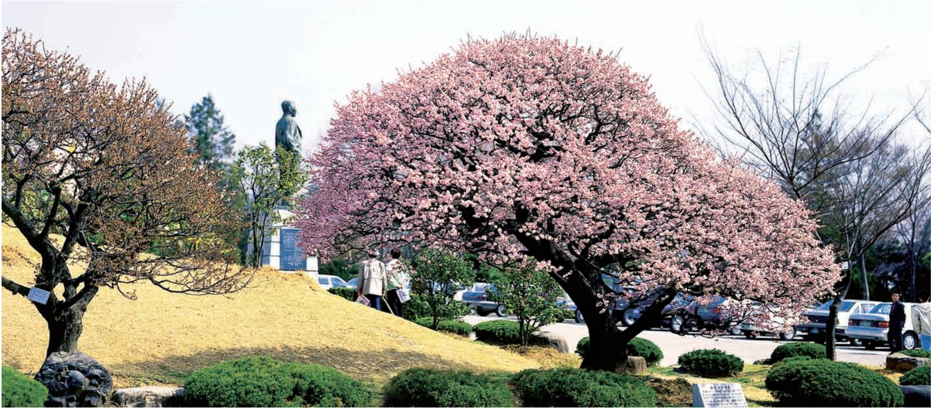
홍매처럼 겸손하면서도 당찬 인재를 키운다