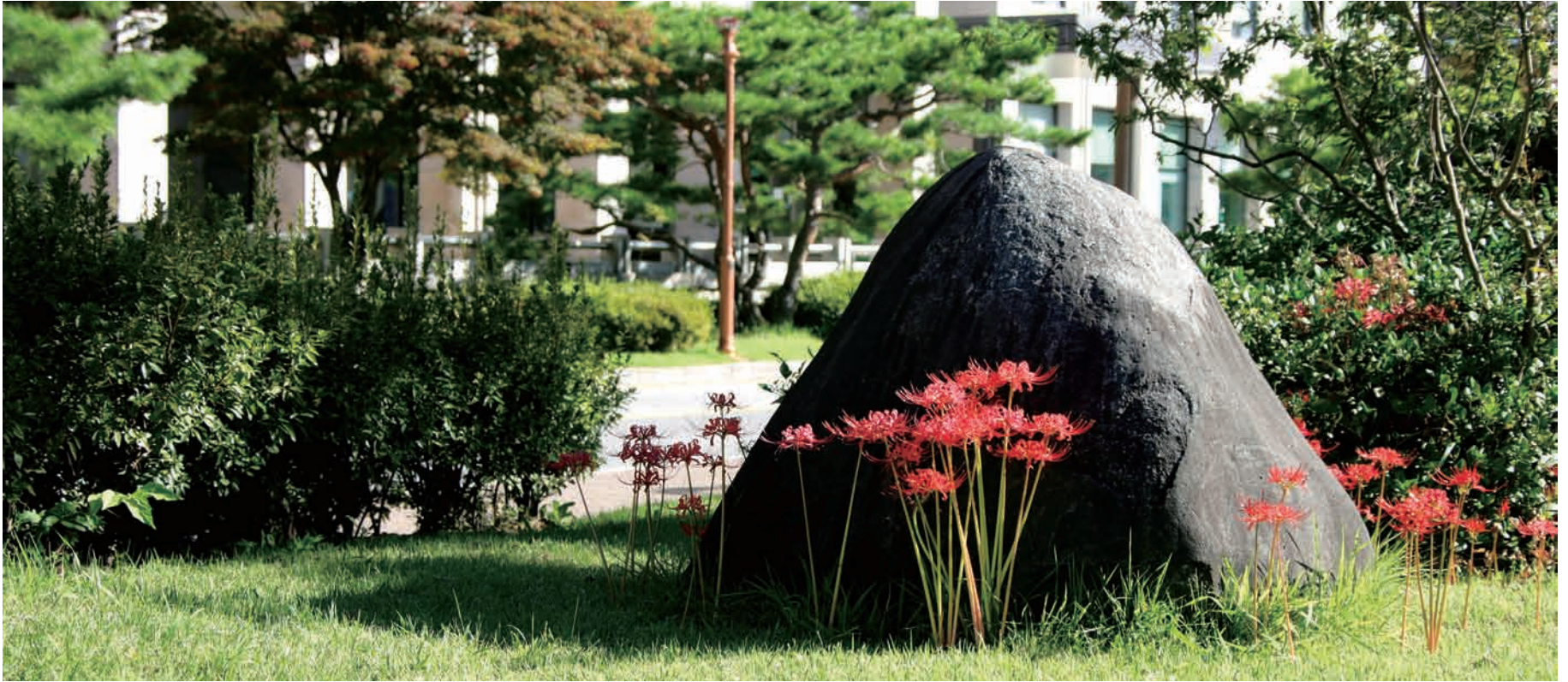
붉은 열정으로 21세기 글로벌 시대를 주도한다