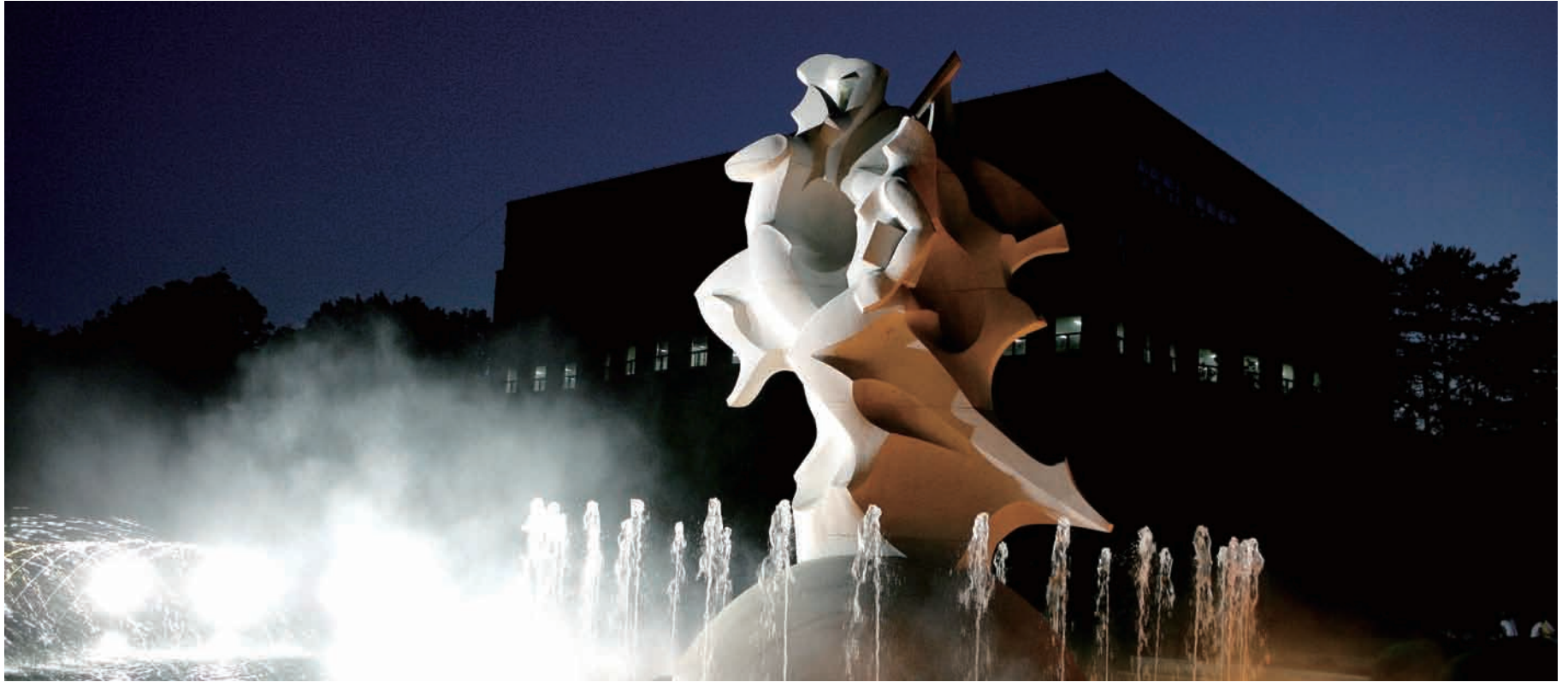
5·18 진원지로서 민주·인권·평화 실현에 앞장선다