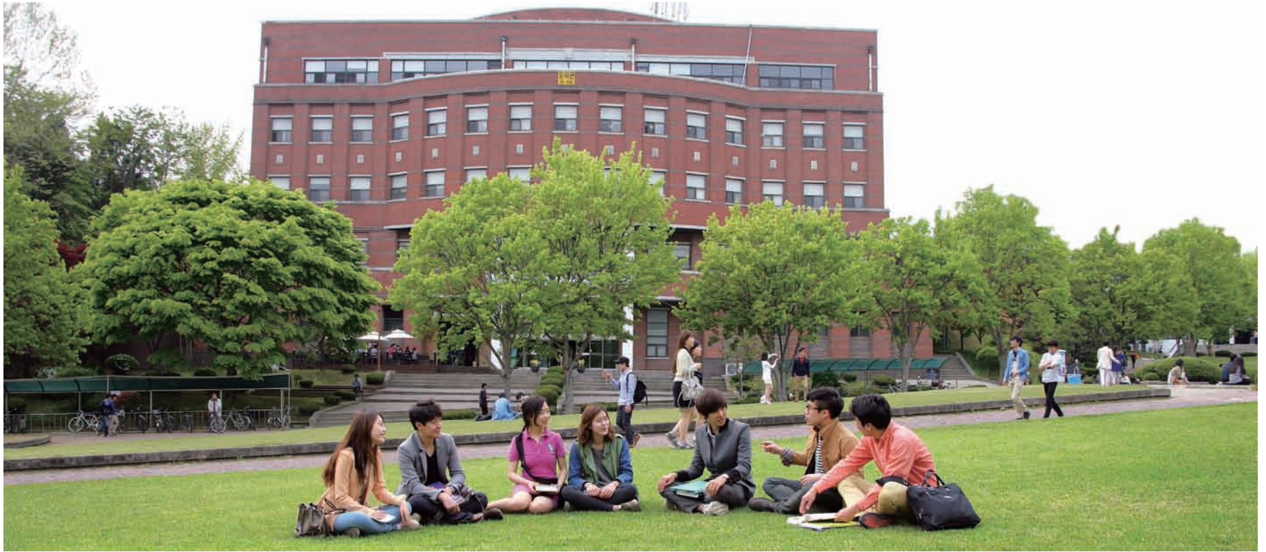
다양한 국제교류로 글로벌 DNA를 깨운다