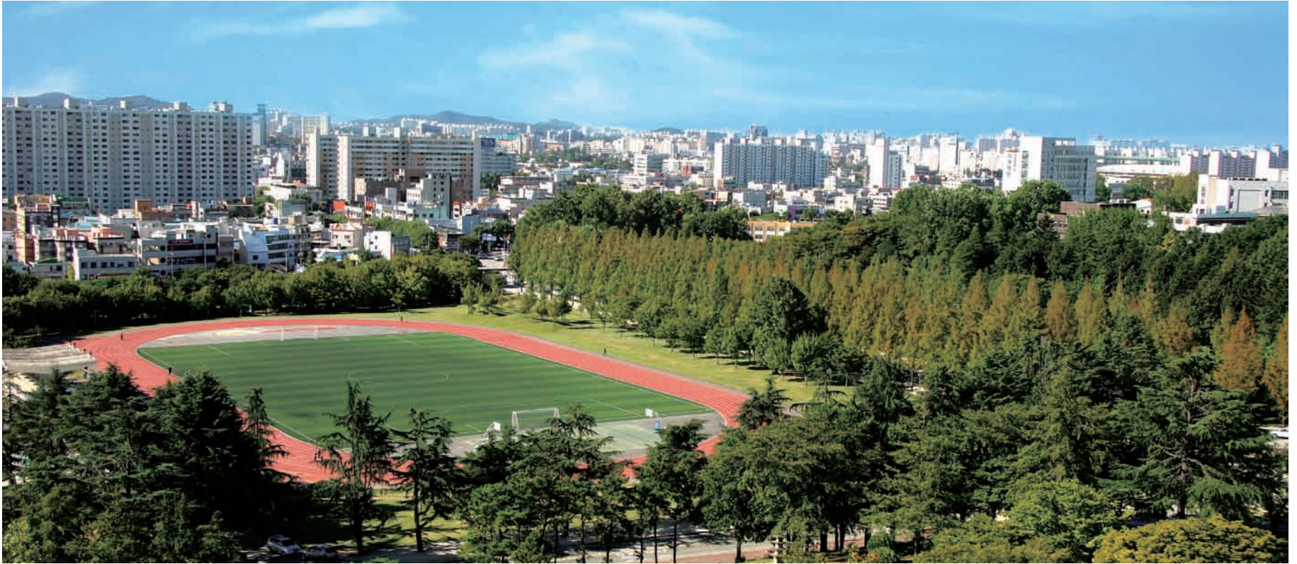
지역 사회와 소통하는 열린 대학을 실현한다