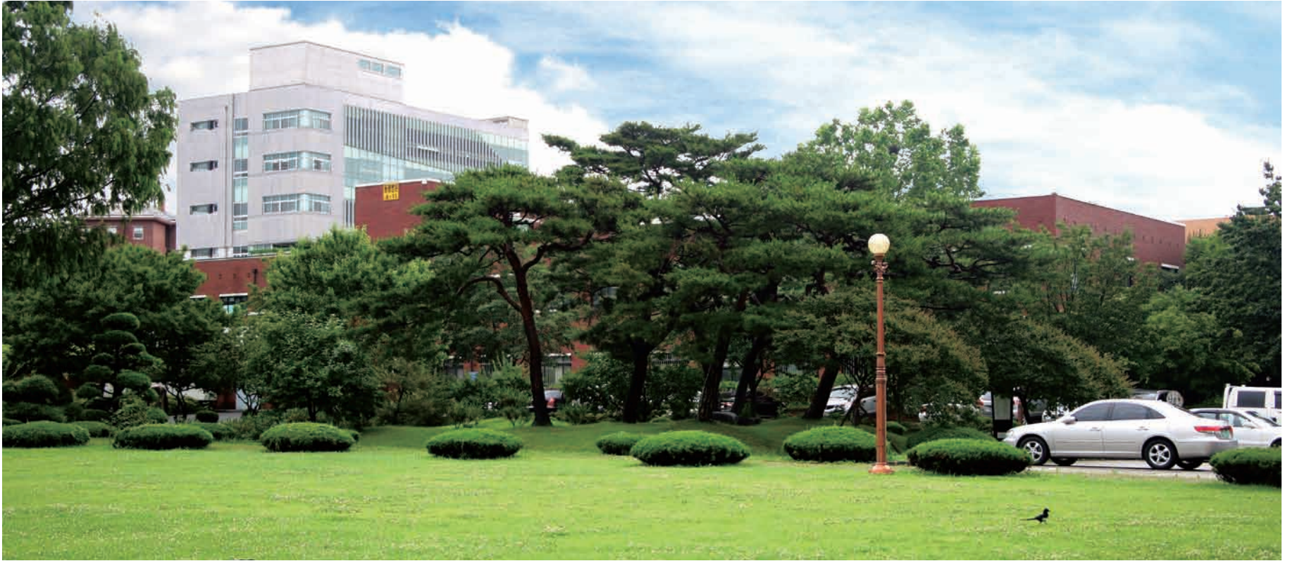
만족도 높고, 자부심 강한 대학의 역사를 이어간다